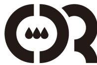
CCR 研究会 Carbon Capture & Reuse